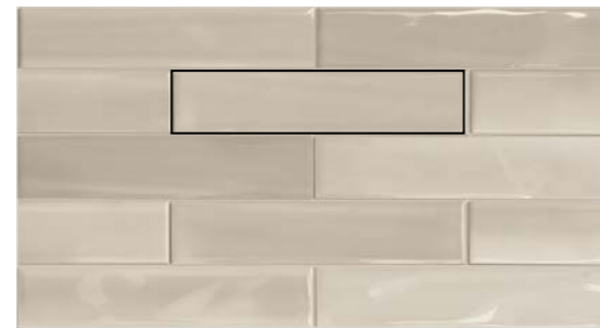
2x30 3/4"x12" Matita Shadebrick Taupe