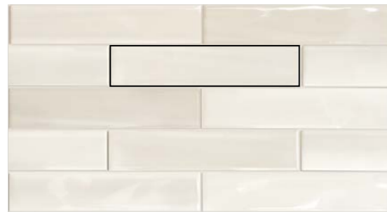
2x30 3/4"x12" Matita Shadebrick Light