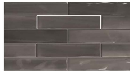
2x30 3/4"x12" Matita Shadebrick Dark