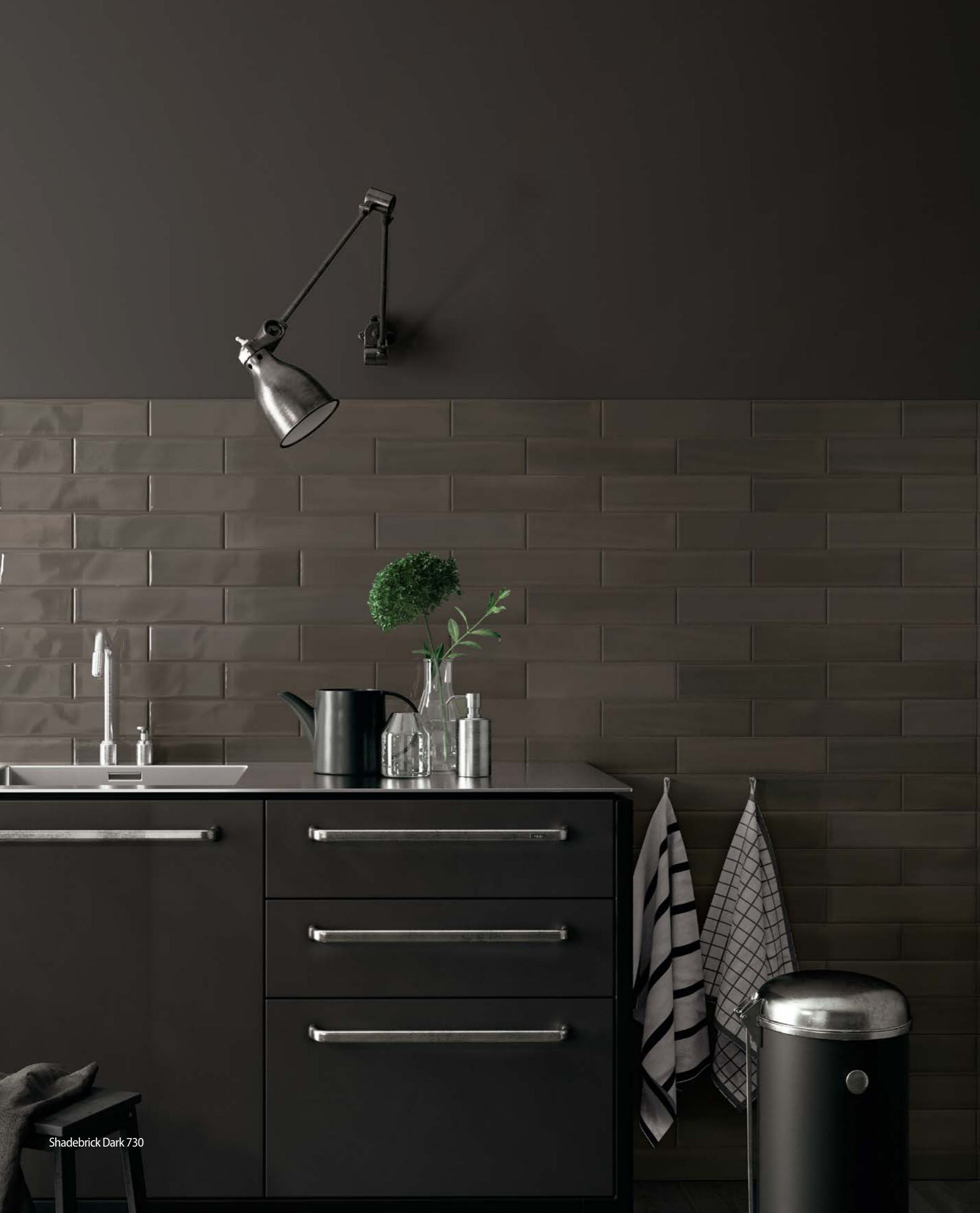
Shadebrick Dark 730