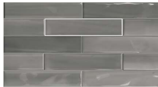
2x30 3/4"x12" Matita Shadebrick Grey