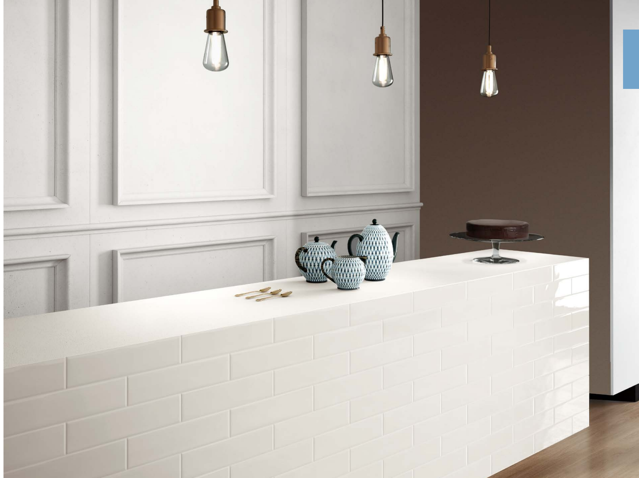
Floor / Primewood Nut 30120 (PRIMEWOOD COLLECTION) Wall / Shadebrick Light 730