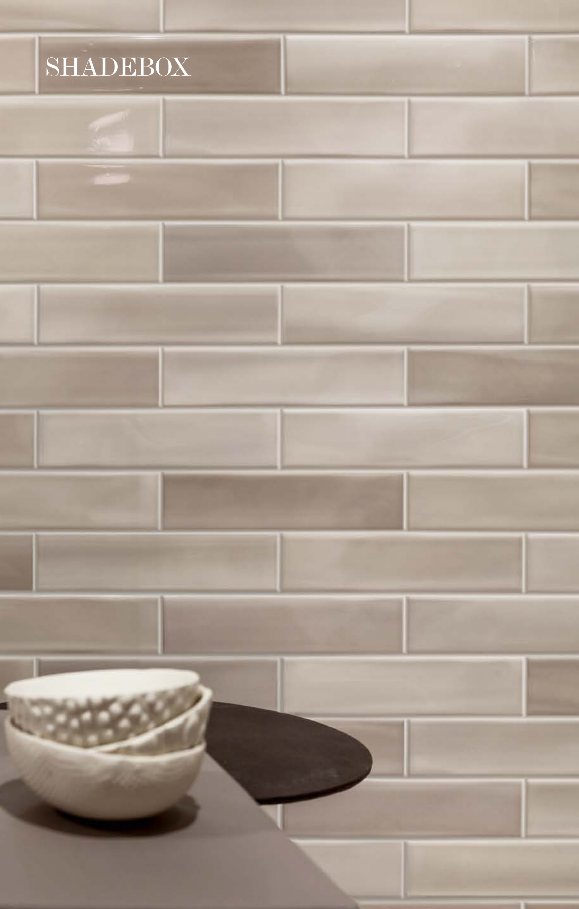
Shadebrick Taupe 730