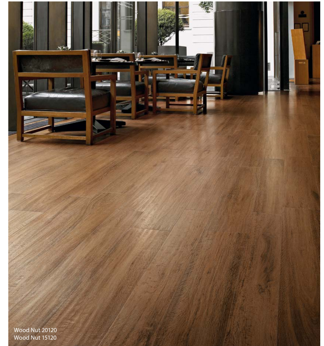
Wood Nut 20120 Wood Nut 15120