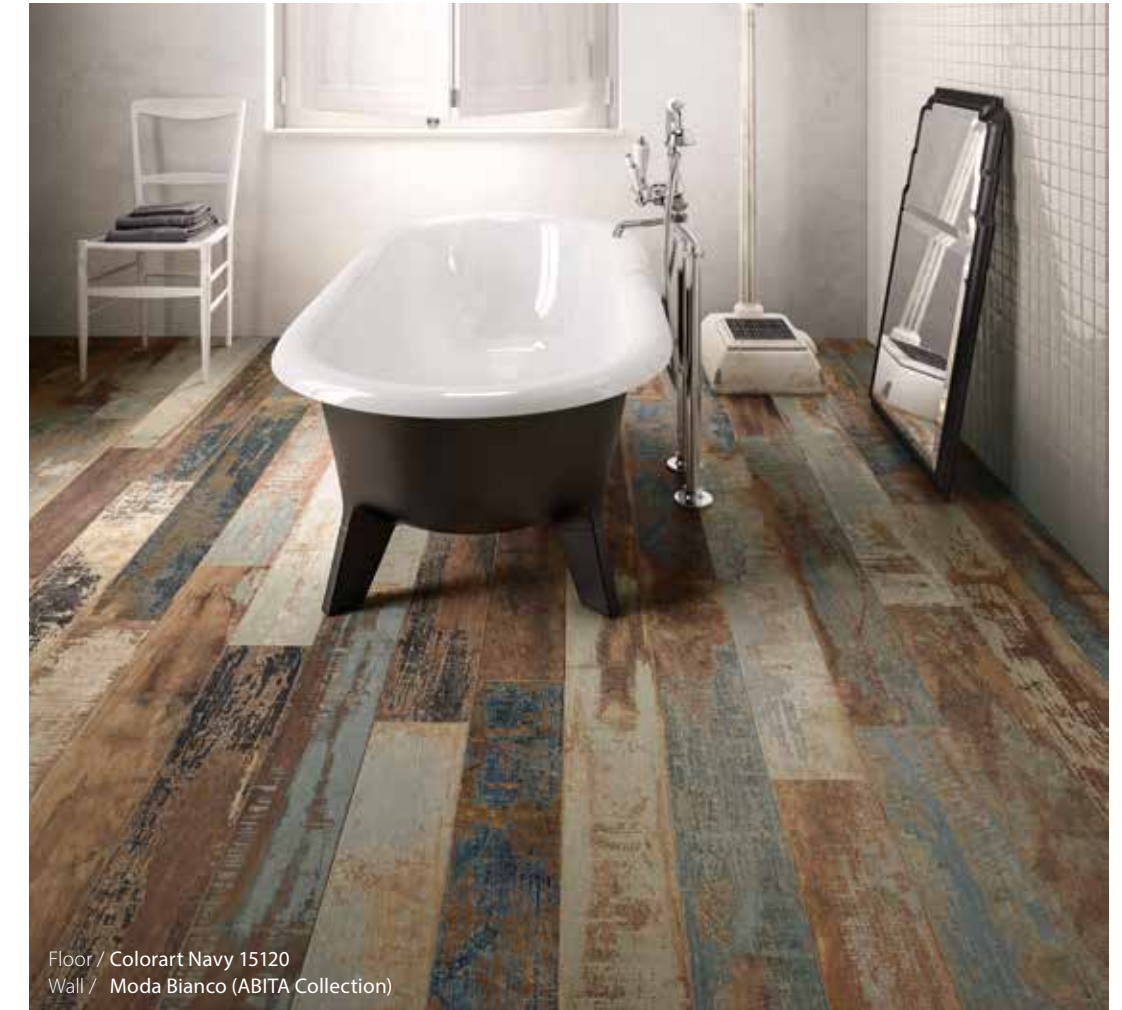
Floor / Colorart Navy 15120 Wall / Moda Bianco (ABITA Collection)